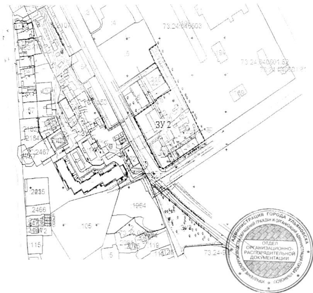
Схема контура 2